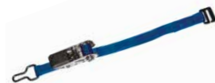
Cliquet + Crochet S