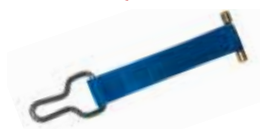
Anneaux de fixation inox anti-soulèvement